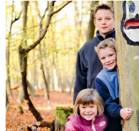
Der Trinkwasser-Erlebnispfad startet und endet an dem Parkplatz an der Landstraße L 310 kurz hinter Fuhrberg Richtung Celle.

Angemeldete Besucher können das Wasserwerk auch gerne von innen besichtigen: Termine erhalten Sie bei Stephan Schröter von unserem BesucherService unter 0511 - 430-2607.