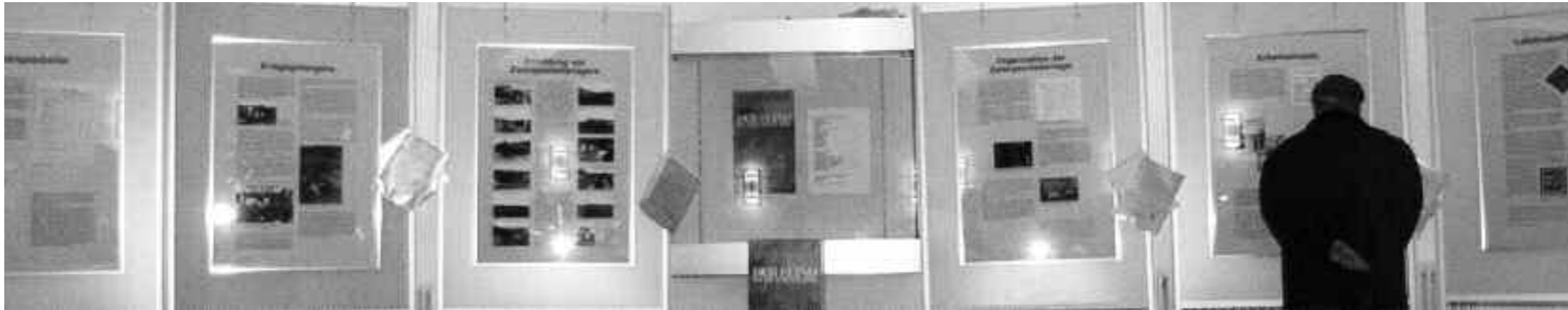
... und im Schloss Landestrost in Neustadt am Rübenberge, 1998

Die Wanderausstellung „Der Feind im eigenen Land. Zwangsarbeit in Hannover im Zweiten Weltkrieg“ kann ausgeliehen werden.