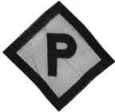
„P“-Zeichen, das polnische Zwangsarbeiter tragen mussten