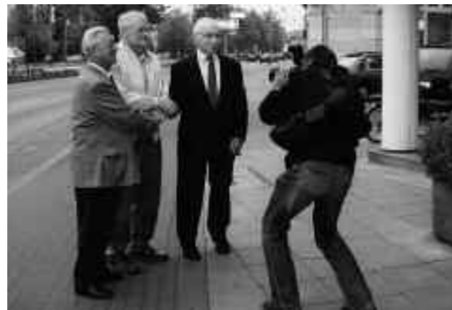
Überlebende zu Gast in Hannover, Mai 2000 und 2004

in Hannover ermöglicht. Die Schilderungen der Überlebenden bieten Außenstehenden zudem einen realistischen sowie atmosphärischen Einblick in das Leben ehemaliger hannoverscher Zwangsarbeiter vor dem Hintergrund der NS-Geschichte. Dadurch besteht die Chance, (gerade durch Einzelschicksale) Sensibilität zu wecken und neue Eindrücke bezüglich dieses gesellschaftlich-politisch relevanten Themas zu gewinnen. Letztendlich wird dadurch die Stadt Hannover auch stellvertretend für andere Großstädte in dieser Zeit und als Beispiel eines bedeutenden Rüstungszentrums betrachtet werden können. Diese Forschung verdeutlicht das quantitative Ausmaß des Arbeitseinsatzes der Zwangsarbeiter, aber auch die Komplexität des Lagersystems und dessen Verflechtungen mit dem gesellschaftlich-politischen Leben.