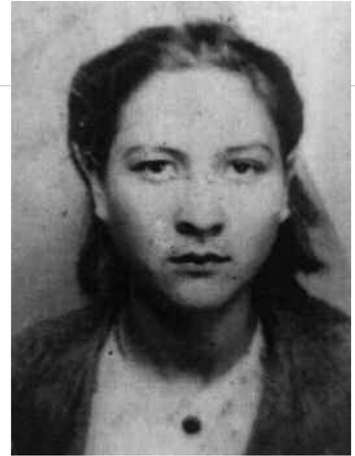
... und nach ihrer Befreiung, 1945