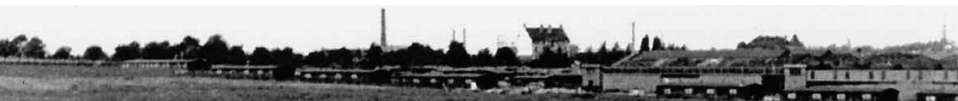
Lager am Schlorumpfskoppelweg, 1942

Zunächst wurde daher eine Wanderausstellung konzipiert und im Mai 1998 mit großem Erfolg zum ersten Mal im Stadtarchiv Hannover präsentiert. Diese Ausstellung durchlief bis zum Mai 2000 mehrere Stationen und ist bis heute in allen Aspekten aktuell. Zahlreiche Vorträge und Aufsätze folgten immer wieder zu verschiedenen Themenschwerpunkten. Bereits im März 2000 wurde das erste Buch mit dem Anspruch, auch für Laien einen umfangreichen Einblick in unterschiedliche Aspekte von Zwangsarbeit zu ermöglichen, präsentiert. Zwischenzeitlich entstand eine Vernetzung zu zahlreichen Organisationen, wie zur Industriegewerkschaft Metall Hannover oder der „Vereinigung der Verfolgten des Naziregimes/Bund der Antifaschisten (VVN/BdA)“, mit denen bis heute eine kontinuierliche intensive Zusammenarbeit besteht. Im Mai 2000 wurden erst- und einmalig zweiundzwanzig ehemalige Zwangsarbeiter nach Hannover eingeladen, unter anderem von der IG Metall, der Stadt Hannover, der Universität Hannover (Projekt: „Hannoversche Lager“) und der VVN/BdA.