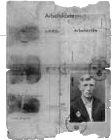
Vorderseite der Arbeitskarte eines polnischen Zwangsarbeiters

Gemeinsamkeiten hinsichtlich des Zeitraums ihrer Internierung, der Nationalität und der Altersstrukturen. Ebenso muss berücksichtigt werden, dass viele Zwangsarbeiter, auch bedingt durch die zunehmende Zerstörung der Stadt gegen Ende des Krieges, nacheinander an mehreren Orten untergebracht waren. Für die individuelle Situation waren daher oft mehrere Komponenten entscheidend, wie Internierungsort/-zeitpunkt und Status des Lagers. Überlebenswichtig waren auch die Art der Arbeit, die Nationalitätzugehörigkeit und das Verhalten der Bewacher sowie interne Lagerstrukturen. Die Verknüpfung dieser verschiedenen Faktoren beeinflusste entscheidend die Lebensumstände und die Überlebenschance des Einzelnen.