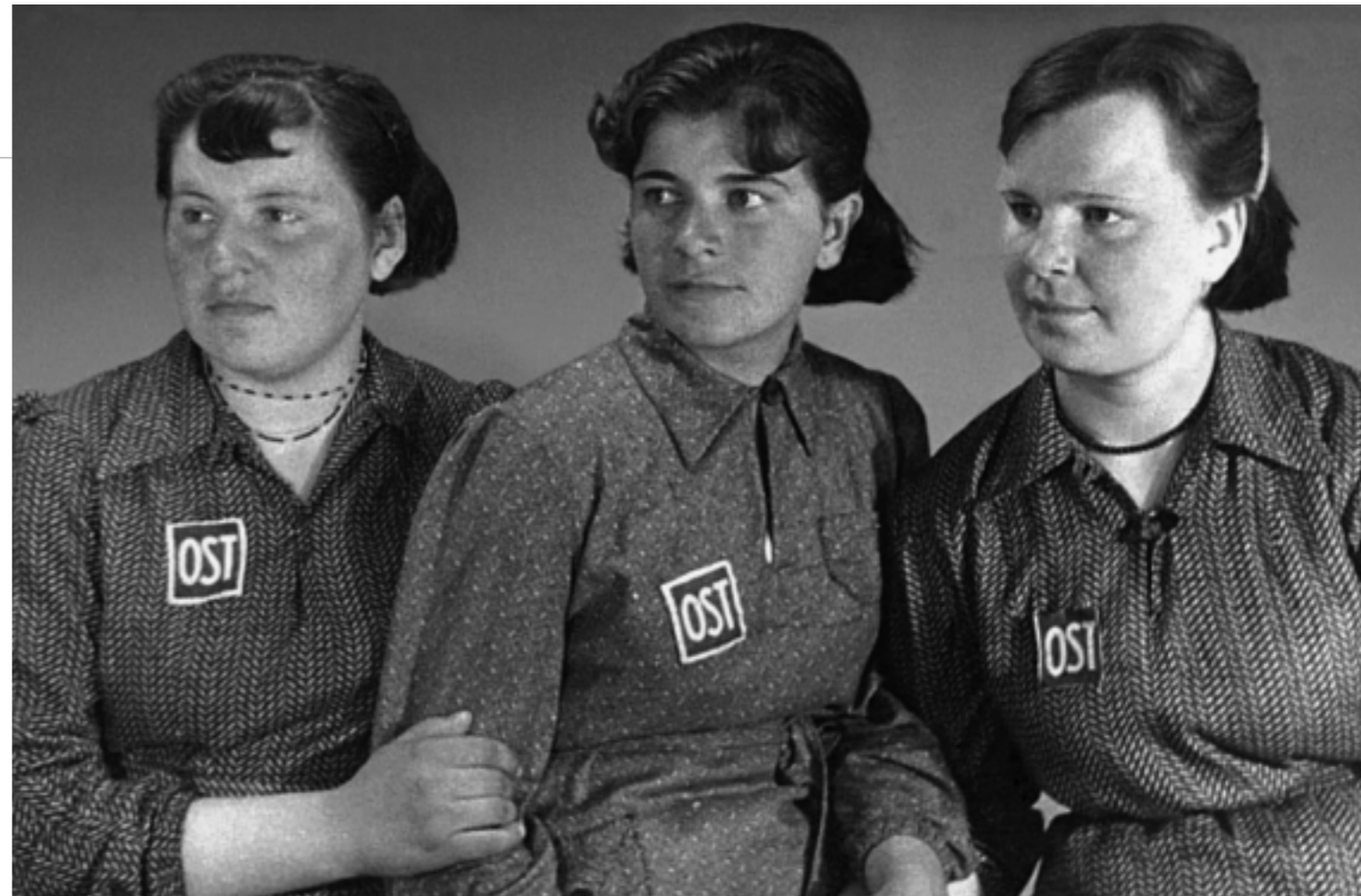
„Ostarbeiterinnen“ der Städtischen Betriebswerke Hannover, Oktober 1943

Auch die kontinuierliche Arbeit für die Nachweisbeschaffung für ehemalige Zwangsarbeiter im Rahmen ihres Renten- beziehungsweise Entschädigungsanspruchs anhand zeitgenössischer Unterlagen erbrachte bislang ein sehr gutes Ergebnis. Die Recherche ergab positive Nachweise in 65 Prozent der speziell bearbeiteten Anträge. Dabei ist zu vermerken, dass die Anfragen bislang trotz Beendigung der Antragstellung in den jeweiligen Ländern nur leicht rückläufig sind. Ferner sind nach der fast abgeschlossenen Auszahlung der ersten Rate der Entschädigung für die so genannte zweite Rate deutlich verschärfte formale Bedingungen in Osteuropa gefordert. Daher müssen auch bereits ausgestellte Bescheinigungen auf Nachfragen verändert und den jeweiligen aktuellen Bedingungen angepasst werden. Eine Trendwende ist zunächst nicht abzusehen, da die Auszahlungen durch die Partnerorganisationen vor Ort weiterlaufen. Die weiterhin dringend notwendigen Recherchen für die geforderten Nachweise müssen daher dauerhaft gewährleistet werden.