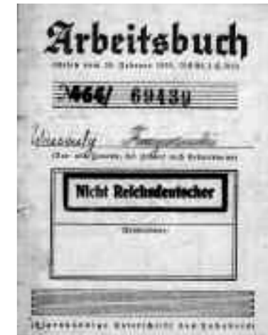
Innenseite des Arbeitsbuches eines polnischen Zwangsarbeiters

Gegen Ende 1944 eskalierte die Situation, bedingt durch die zunehmenden Luftangriffe. Die allgemeine Verschlechterung der Überlebensbedingungen betraf die Zwangsarbeiter im besonderen Maße. Unter ihnen gab es viele Tote – allein durch die Angriffe. Ein Teil der Lager war zerstört, andere erheblich überbelegt. Von der Situation besonders stark betroffen waren körperlich schwache Zwangsarbeiter. Die Todesrate unter den verschleppten Kindern, alten Menschen, Kriegsgefangenen oder so genannten „Ostarbeitern“ war dadurch besonders hoch.