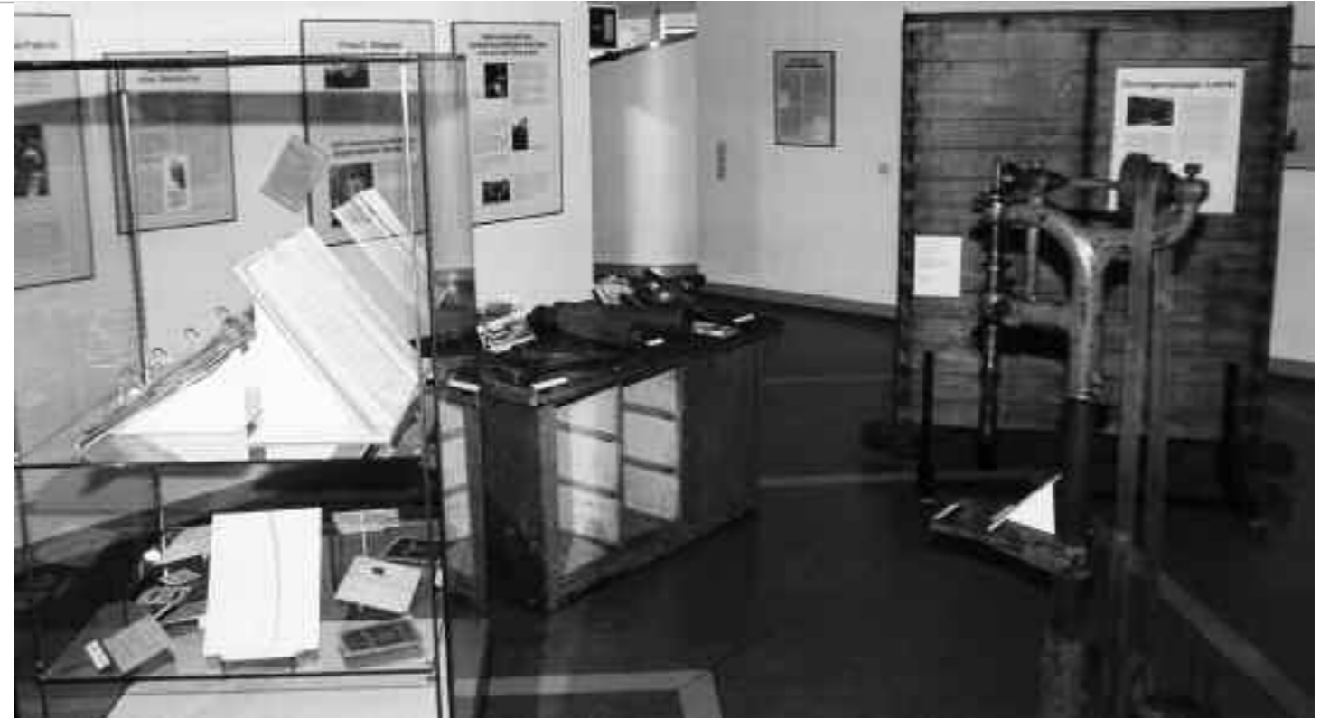
Im Stadtarchiv Hannover ...